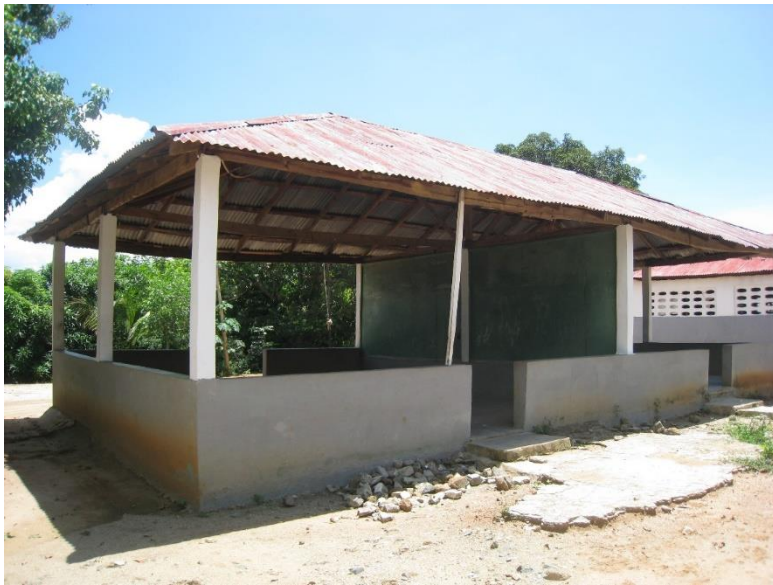
L'une ouverte ( devant )